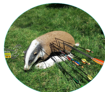
Exemple de tir 3D

Les archers sont répartis par peloton de 4 et tirent 1 à 1.