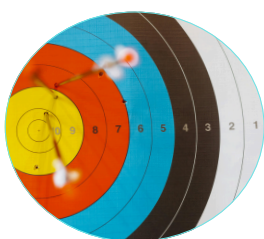
Cible avec les points indiqués pour chaque couleur

Le tir à l'arc est un sport amical et sympathique. J'ai choisi ce sport car il m'attire depuis toute petite, et me passionne. Ça m'a beaucoup apporté : la joie, de nouveaux amis, de la compétitivité, du fair-play et bien sûr comme dans bien d'autres endroits, l'amour.